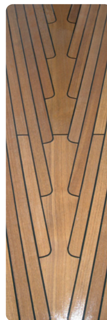
Después de la limpieza con Nanoprotec® Yachts