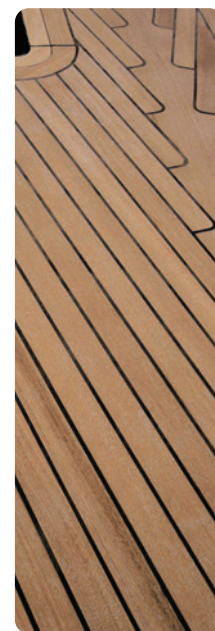
Después de 5 meses con el protector Nanoprotec® Yachts