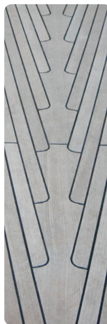
Antes de la limpieza Nanoprotec® Yachts

Es conocido que el agua de lluvia no puede mantenerse en las hojas de la flor de loto y resbala. ¿Pero a qué es debido?. Aunque no es posible visualizar esta propiedad a simple vista, con microscopios adecuados puede observarse cómo la superficie de las hojas está formada por numerosos y pequeñísimos bultos, creando una capa protectora consistente en cristales de cera natural. Esta textura no permite que la suciedad ni los líquidos se depositen sobre ella. Este hecho ha sido imitado por los científicos y llevado a la práctica, utilizándolo en los nanorevestimientos de materiales, disminuyendo eficazmente la presencia de suciedad de muchas superficies y mejorando paralelamente las facilidades para su limpieza.